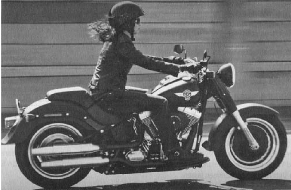
The new Fat Boy® Special

ONE ROAD. YOUR JOURNEY. OUR MOTORCYCLES.