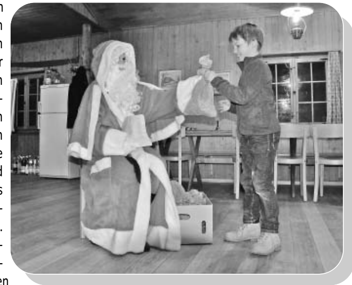
«Für die Minis hatte der Samichlaus Geschenke dabei»

Auch dieses Jahr begaben sich frohmütige Minis an einem frühen Donnerstagabend im Dezember in Richtung der Waldhütte Buchs. Und auch dieses Jahr wurde die Waldhütte mit lautem Getöse in Beschlag genommen. Doch ein Klopfen an der Tür, schwere Schritte, Glockengeläut – und in der Waldhütte wurde es urplötzlich still. Das Wort gehörte fortan dem Samichlaus... Das eine oder andere Sprüchlein wurde vorgetragen, ehrfürchtig Lob und Tadel entgegen genommen aber spätestens beim Verteilen der Chlaussäckli war der Samichlaus allseits sehr beliebt. Mit viel Getöse ging es dann auf den Rückmarsch in Richtung Waldeingang zurück.